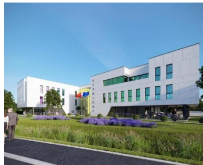
Immeuble Hermione – Pierre de Seine