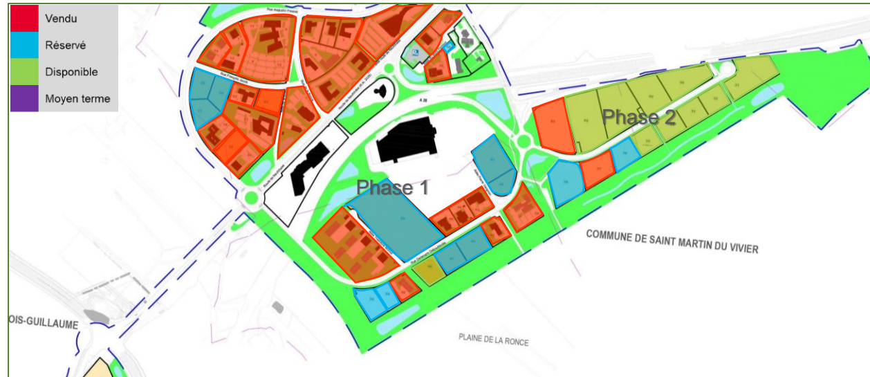
Plan masse général