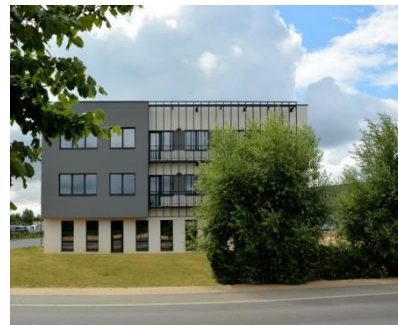
Immeuble Next Office – Greestone