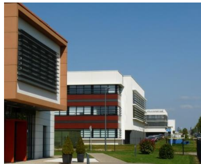
Immeuble Victoria – Cap Horn Promotion