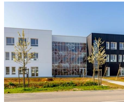
Immeuble Hémisphère – Pierre de Seine