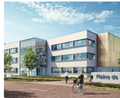
Immeuble de bureaux – Atlantis