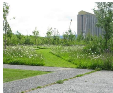
Parc de la Presqu'île