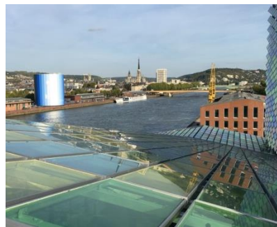
Le 108 – Siège Métropole Rouen Normandie