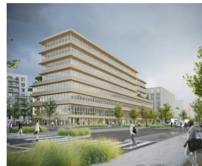
L'Eveil de Flaubert – Linkcity – TVK-AZ Architectures