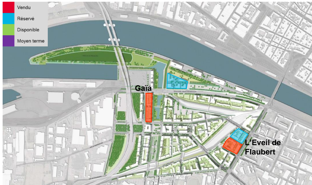
Plan masse général