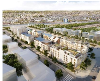
Gaïa – Odysée Immobilier – Atelier des 2 anges