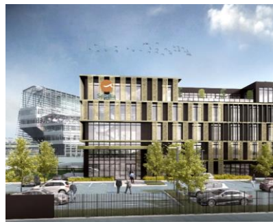
Senalia – siège social - Artefact